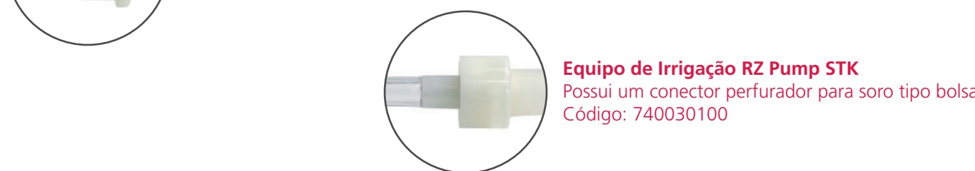
Equipo de Irrigação RZ Pump STK Possui um conector perfurador para soro tipo bolsa Código: 740030100