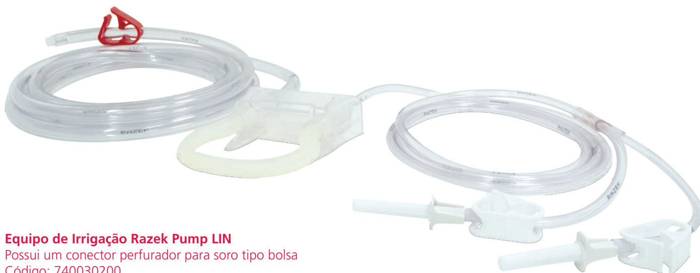
Equipo de Irrigação Razek Pump LIN Possui um conector perfurador para soro tipo bolsa Código: 740030200