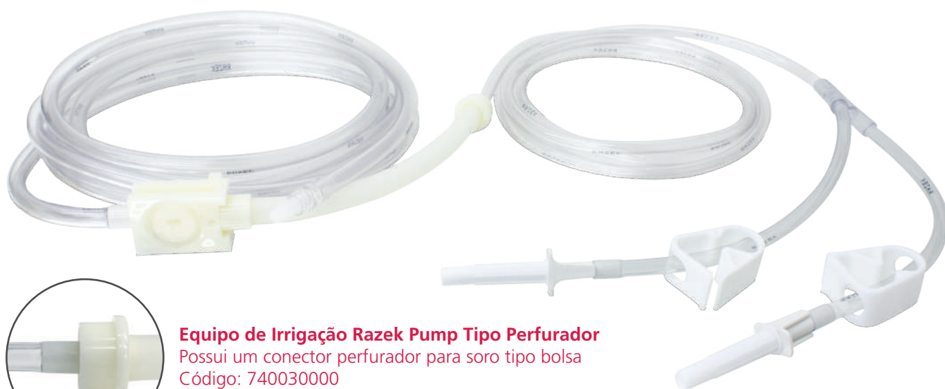
Equipo de Irrigação Razek Pump Tipo Perfurador Possui um conector perfurador para soro tipo bolsa Código: 740030000

n.º ANVISA: 80356130016, 80356130091 e 80356130169 Imagens meramente ilustrativas