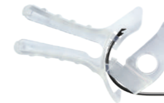
Gancho FP + Insersor do Gancho FP