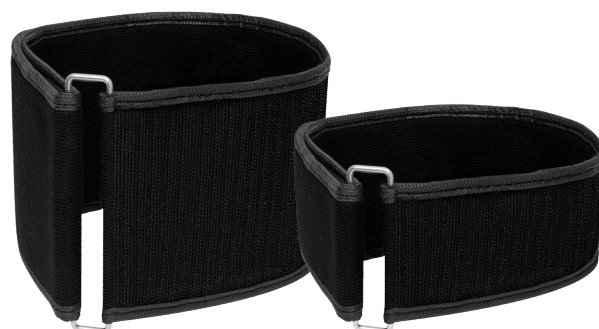
Pulseira de Restrição do Braço