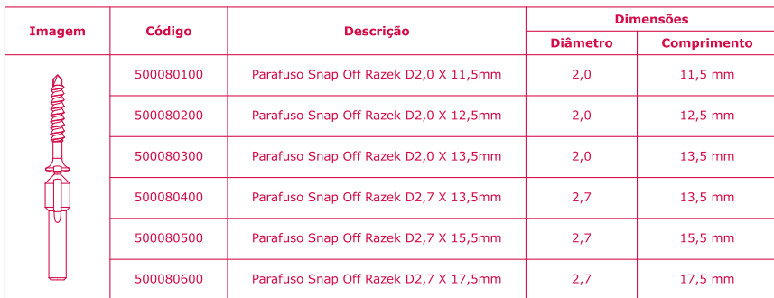
Tabela 5 – Descrição dos Modelos do Parafuso Snap Off Razek.

A Tabela 5 apresenta a descrição dos produtos objeto desse processo de registro.